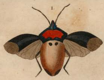
1. Scutellera Schonherri 2. S. Germari