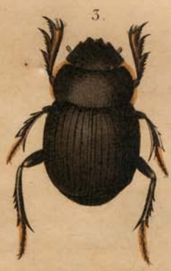
1. Lucanus tibialis 2. Aulacodus flavipes 3. Megathopa villosa a. Palp. maxill. 4. Deltotichilum dentipes a. Palp. maxill. b. vu de côté