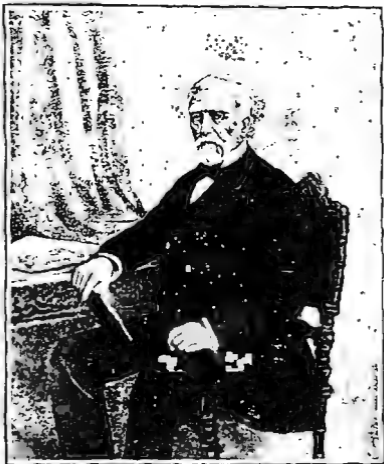
O Visconde de Mauá em 1882.