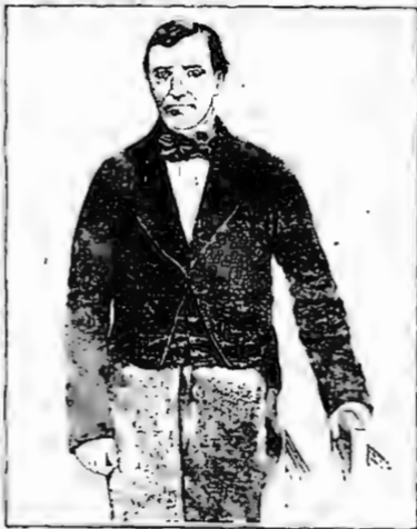
O Barão de Mauá em 1858.

(Sisson. Galeria de Brasileiros ilustres).