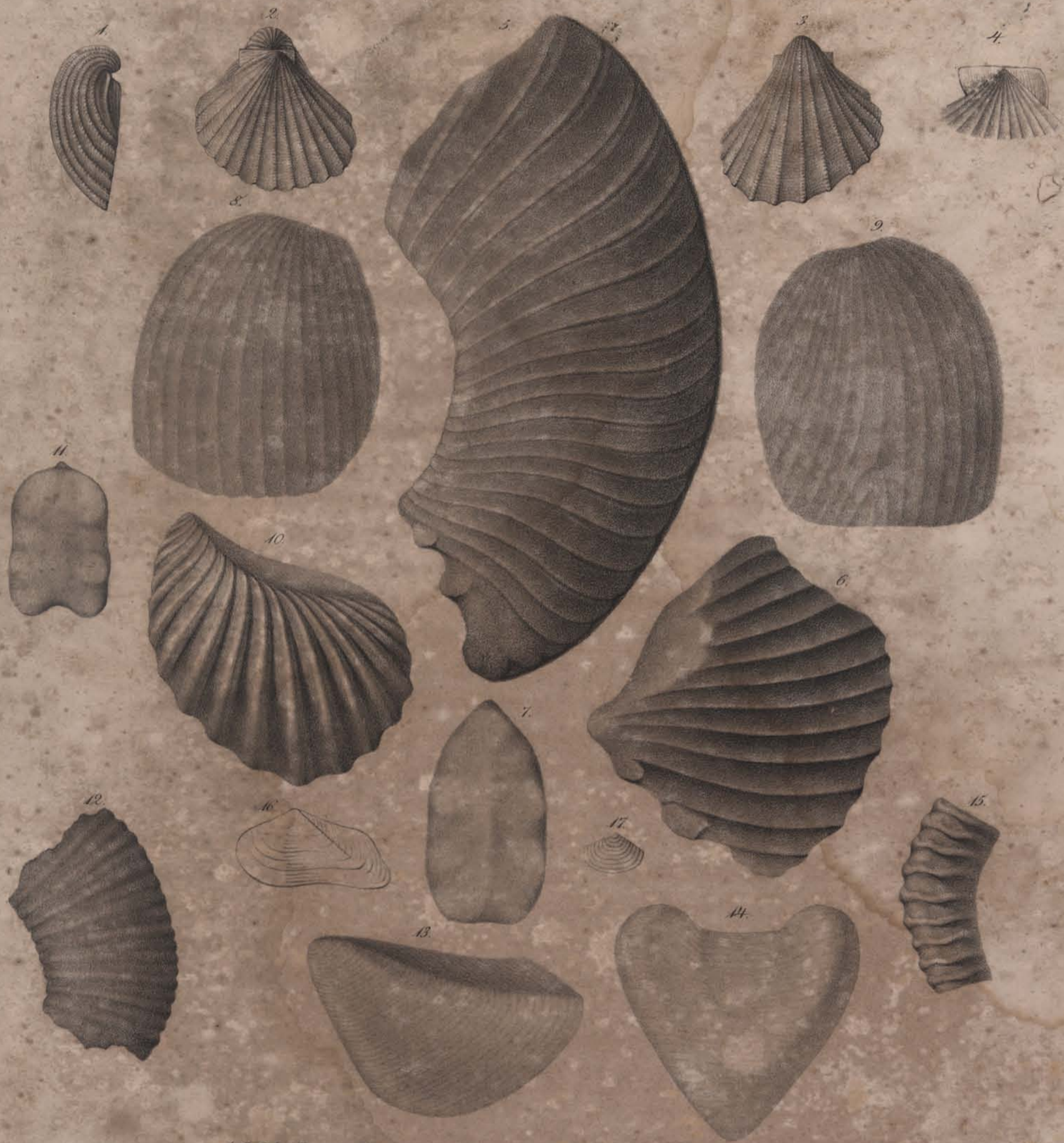
1. 2. 3. 4. Pecten alatus . 5. 6. 7. Ammonites peruvianus . 8. 9. Isocardia . 10. Virgenia alaeformis . 11. 12. Ammonites aequaliorialis .