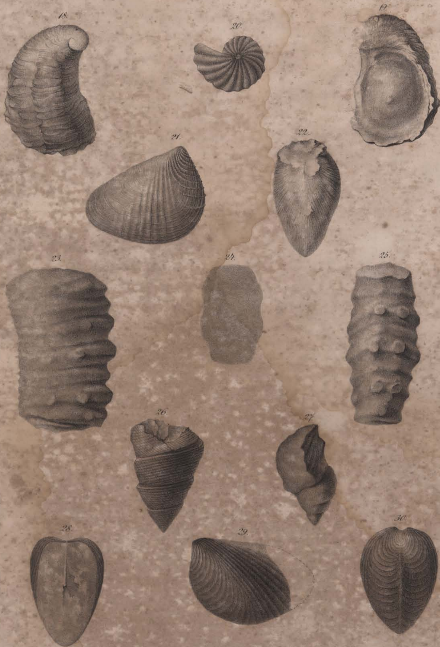
18. 19. Exogyra polyzona 20. Ammonites galeatus 21. 22. Trigonia abrupta 23. 24. 25. Hamites .