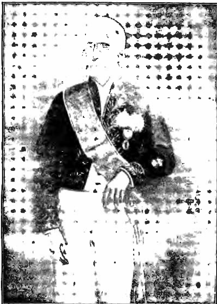
AFONSO CELSO, COM A FARDA DE MINISTRO DO IMPÉRIO.