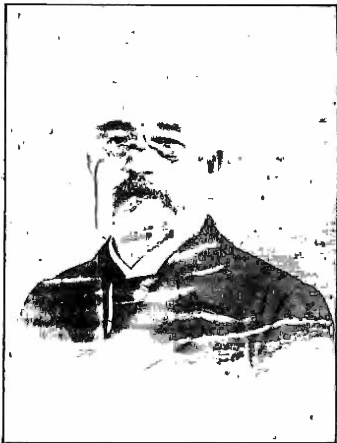
AFONSO CELSO DE ASSIS FIGUEIREDO VISCONDE DE OURO PRETO