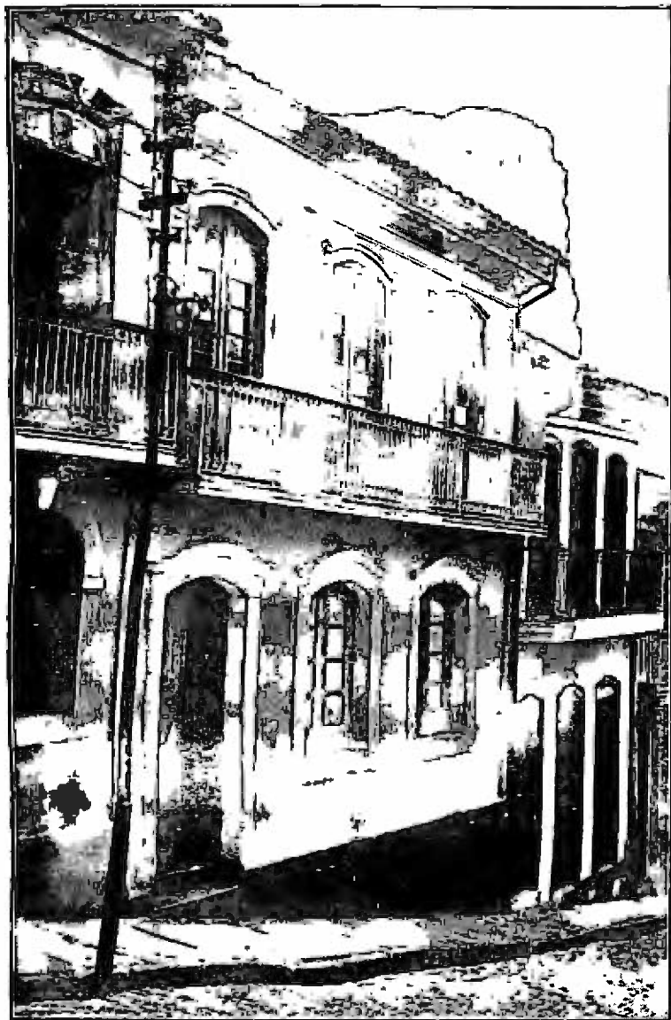
CASA EM QUE NASCEU O VISCONDE, EM OURO PRETO, MINAS. CONSERVA AINDA HOJE A MESMA DISPOSIÇÃO INTERNA E A MESMA FACHADA.